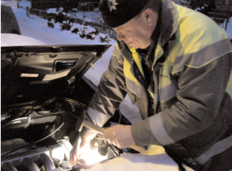
«Gelber Engel» Sämu: Hammer für das Getriebe, Fingerspitzengefühl für die Kunden

Der Touring Club der Schweiz hat rund 1 450 000 Mitglieder. 1200 TCS-Mitarbeiter sorgen dafür, dass kein Kunde stehen bleibt. Für diese heikle Aufgabe werden sie gut vorbereitet. Technisches Wissen allein reicht dafür nicht aus. Es geht immer um Menschen in unerfreulichen Situationen. Ein Bericht aus der TCS-Zentrale Schönbühl bei Bern.